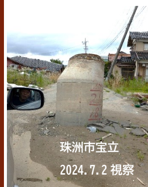
液状化でマンホールが突出した道を車で通り抜ける

資料に限りあり。なるべく予約を。 070-2172-8480(予約・連絡・活動用)